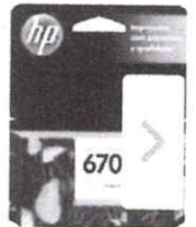
Cartucho de Tinta HP Amarelo - Original

de R$999,00 por R$719,10 à vista ou R$ 799,00 10x de R$ 79,90 sem juros