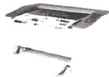
Impressora HP Laser 107A Preto e Branco -

de R$1.299,00 por R$899,10 à vista ou R$ 999,00 10x de R$ 99,90 sem juros